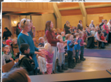
Masser af børn til før-påske-gudstjeneste