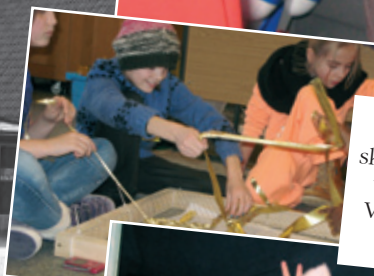
Eleverne fra 3. klasse skabte i Kirkeugen en flot udsmykning til kirken. Værket ses på forsiden - og i kirken!