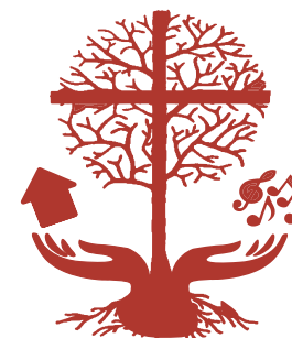
FREDENS KIRKES MENIGHEDSRÅD

I denne tid arbejder menighedsrådet i Fredens Kirke en hel del med ombygning af kirken - både kirkerummet og de øvrige lokaler. Vi er nået langt og glæder os til fremtiden, hvor dette også vil fylde en hel del.