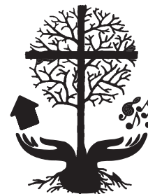
FREDENS KIRKES MENIGHEDSRÅD

Det kan godt virke som om, at der er mange ting at sætte sig ind i som nyt menighedsrådsmedlem. Men du får rådgivning og hjælp i hverdagen. Det sker blandt andet gennem provstiet, der har konsulenter klar til at hjælpe med spørgsmål om økonomi, personale og bygninger.