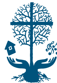
FREDENS KIRKES MENIGHEDSRÅD