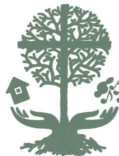
FREDENS KIRKES MENIGHEDSRÅD

At reflektere over taknemlighed og dens værdi kan give os et andet perspektiv på verden.